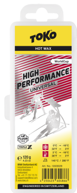
HP Hot Wax universal/red