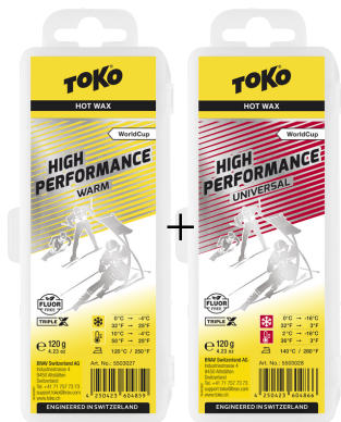
1/2 HP Hot Wax warm/yellow

Reccomandation: Recommandés: Consigliati: