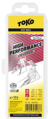
HP Hot Wax universal/red

Reccomandation: Recommandés: Consigliati: