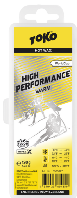
1/3 HP Hot Wax warm/yellow

Reccomandation: Recommandés: Consigliati: