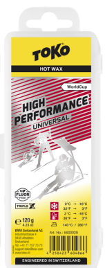
2/3 HP Hot Wax universal/red