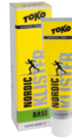
Nordic Base Klister green Snow 0 °C – -30 °C Snow 32 °F – -22 °F