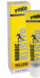
Nordic Klister yellow Snow 0 °C – -2 °C Snow 32 °F – 28 °F