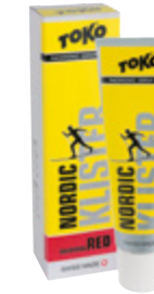
Nordic Klister red Snow -1 °C – -8 °C Snow 30 °F – 18 °F