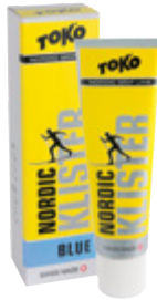
Nordic Klister blue Snow -7 °C – -30 °C Snow 19 °F – -22 °F