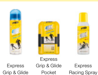
Express Grip & Glide Express Pocket Express Racing Spray

Prima di applicare la sciolina pulire sci e squame con Waxremover.