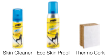
Skin Cleaner Eco Skin Proof Thermo Cork

Pulire la pelle con Skin Cleaner prima del trattamento con la sciolina.