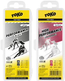
HP Hot Wax Black/Universal