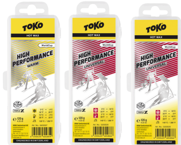
HP Hot Wax Warm & Universal